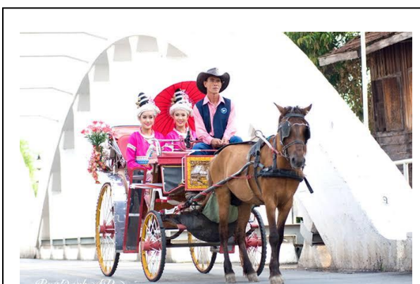
รถม้าลือลั่น