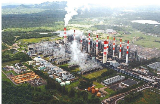
ถ่านหินลือชา