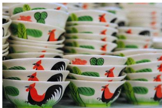
เครื่องปั้นลือนาม