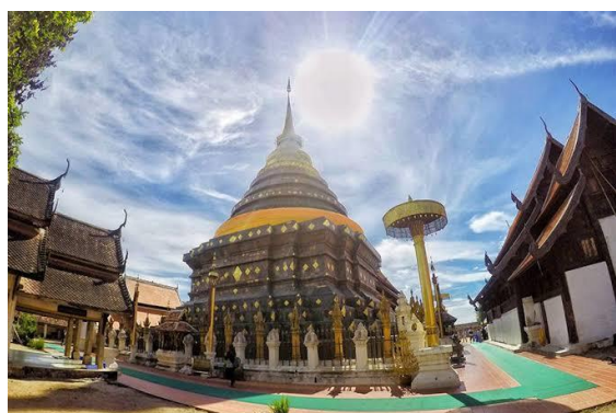
งามพระธาตุลือไกล