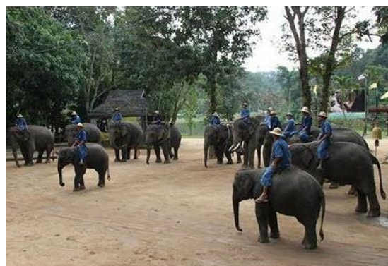
ฝึกช้างใช้ลือโลก